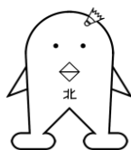
キダリーナちゃん