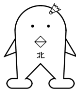
キダリーナちゃん