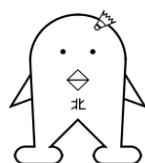
キダリーナちゃん